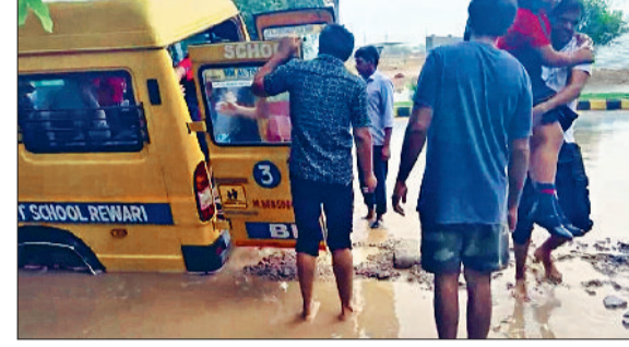
रेवाड़ी। गांव हरजीपुर में बरसात से टूटी सड़क, गद्दी बोलनी रोड पर फंसी स्कूल बस में से बच्चे उतारते कर्मचारी, बरसात का पानी निकलने के बाद अस्पताल में पड़े ढीकल।

गया, जिससे पार्किंग में खड़े वाहन भी पानी में गिरने शुरू हो गए। देखते ही देखते अस्पताल परिसर में पानी ही पानी नजर