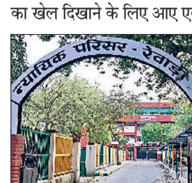
रेवाड़ी। सचिवालय के पास स्थित जिला न्यायिक परिसर।