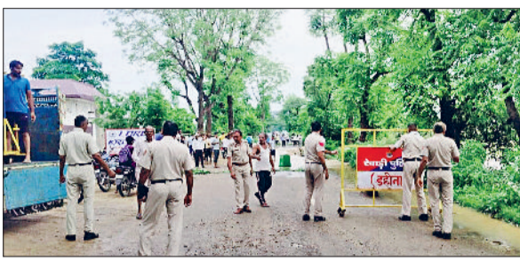
रेवाड़ी। निमोट के पास डहीना-कुंड मार्ग पर बेरिकेड्स लगाते हुए पुलिसकर्मी तथा पहाड़ों से आए पानी में डूबी बाजरे की फसल।

दो दिन से हो रही बारिश के कारण धवना व खोल के पहाड़ों का पानी मंदोला व धवना के खेतों से होते हुए कई घरों तक में घुस गया। धवना नहर के पास पानी निकासी नहीं होने के कारण लोगों ने नहर तोड़ दी, जिससे यह पानी धवना के रास्ते निमोट के खेतों में पहुंच गया। डहीना और मंदोला के बीच पानी रोड क्रास कर गया, जिससे सड़क का काफी हिस्सा पानी में बहकर टूट गया। इस मार्ग