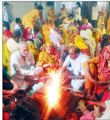
रेवाड़ी। हवन में आहुति डालते हुए गायत्री परिवार के सदस्य।