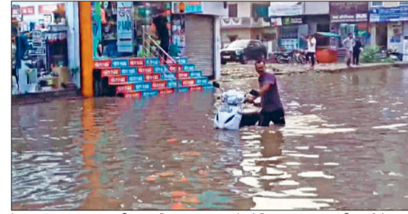
रेवाड़ी। डबल फाटक अंडरपास में भरा पानी व निकलता रेहड़ी चालक, मॉडल टाउन में जमा बरसात का पानी, नागरिक अस्पताल के वेंटिंग हॉल व गायनी वार्ड में भरा पानी।