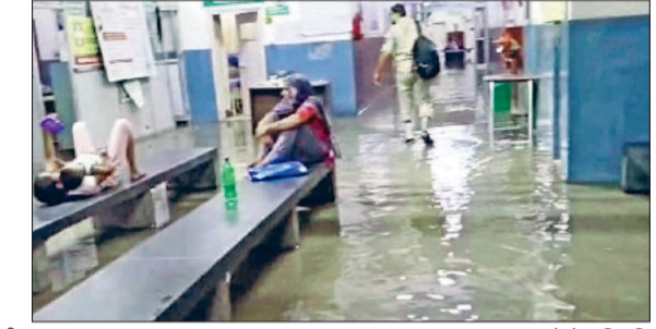
रेवाड़ी। डबल फाटक अंडरपास में भरा पानी व निकलता रेहड़ी चालक, मॉडल टाउन में जमा बरसात का पानी, नागरिक अस्पताल के वेंटिंग हॉल व गायनी वार्ड में भरा पानी।