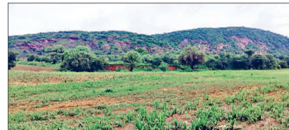
रेवाड़ी। धवना के पास एक खेत में भरा बरसाती पानी, सड़क टूटने के बाद मंदोला-कुंड रोड पर खड़े वाहन तथा धवना के इस पहाड़ से पानी बाढ़ की तरह आया।