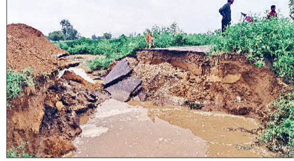
रेवाड़ी। गांव हरजीपुर में बरसात से टूटी सड़क, गद्दी बोलनी रोड पर फंसी स्कूल बस में से बच्चे उतारते कर्मचारी, बरसात का पानी निकलने के बाद अस्पताल में पड़े ढीकल।

बाद में बच्चों को बस से सुरक्षित बाहर निकाल लिया गया। शहर की सफाई व्यवस्था तार-तार नजर आई। अगर इस समय फिर से भारी बारिश होती है, तो इससे शहर में बाढ़ जैसे हालात बन सकते हैं। नगर परिषद से लेकर पब्लिक हेल्थ तक के कर्मचारी पानी निकासी को सुचारू करने में लगे हुए थे। बुधवार देर रात से ही बारिश शुरू हो गई थी। मानसून की दस्तक के बाद वीरवार को पहली बार भारी बारिश हुई। बारिश के साथ ही शहर में जलभराव होना शुरू हो गया। नागरिक अस्पताल में रैप से पानी अंदर प्रवेश कर