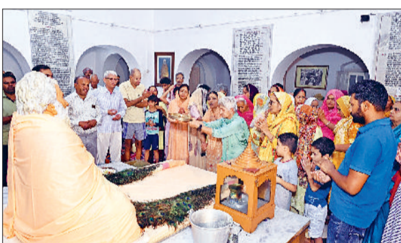
रेवाड़ी। भगवत भक्ति आश्रम में गुरु पूजा करते श्रद्धालु।