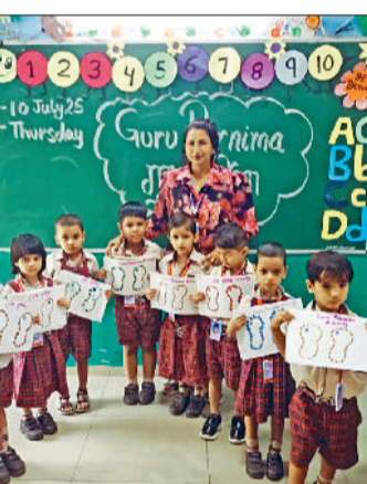
रेवाड़ी। कार्यक्रम में मौजूद शिक्षक व बच्चे।